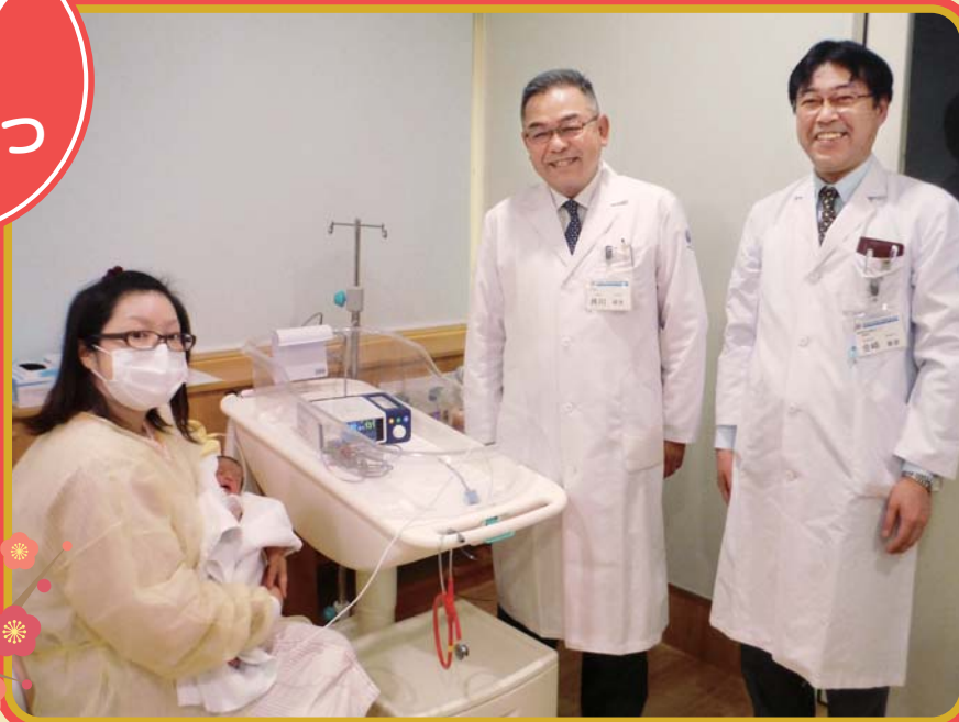
「周産期母子医療センター NICUにて」