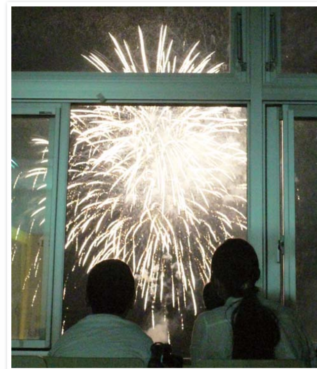
花火を楽しむ小児患者さんとそのご家族

15分間の楽しいひとときは瞬間に過ぎました。神戸川側から送られた終了の合図に、病棟の子どもたちからは、懐中電灯の光で「ありがとう」の気持ちを伝えました。