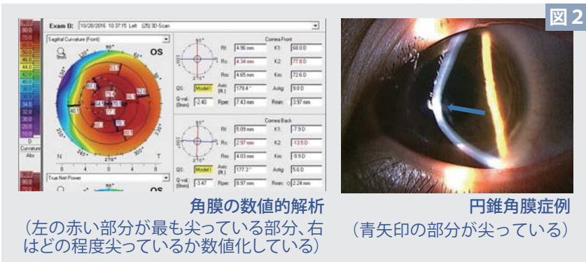
角膜の数値的解析(左の赤い部分が最も尖っている部分、右はどの程度尖っているか数値化している) 円錐角膜症例(青矢印の部分が尖っている)